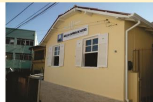
Núcleo Espírita de Artes 13/05/1988