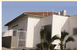
Federação Espírita Catarinense 24/04/1945