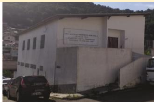
Casa Espírita Frederico José Rolla 01/05/1997