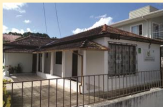
Casa Espírita Joana de Angelis 18/04/2017

Parabenizamos as instituições espíritas que fazem aniversário nos meses de abril e maio.